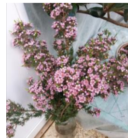
תמונה מס' 2: ענפי קטיף של הזן 'Eric gohn'

נחוץ זמן נוסף על מנת ללמוד באופן מדויק יותר את צפיפות השתילה הרצויה, להרחיב יותר את בחינת חיי המדף ולהתקדם בלימוד פוטנציאל היבול ואיכות הענפים. המשך המחקר בעונה הבאה יתרום עוד להרחבת הידע החסר.