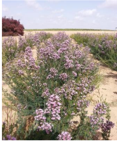
תמונה מס' 1: מכלוא של פרח שעווה וורטיקורדיה 'Eric Gohn' בפריחה