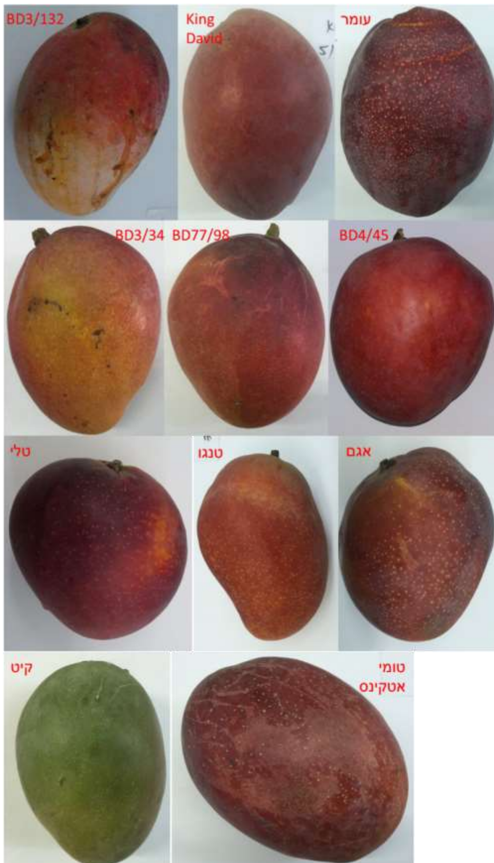
תמונה 2: תמונות מייצגות של פירות מנגו של חלק מהזנים והקווים הנבחנים בחלקה.