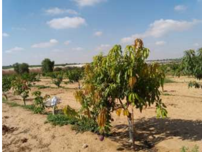
תמונה 1: מטע המנגו ביוני 2018. עצים מורכבים נושאי פירות ולידם עצים שהורכבו מחדש