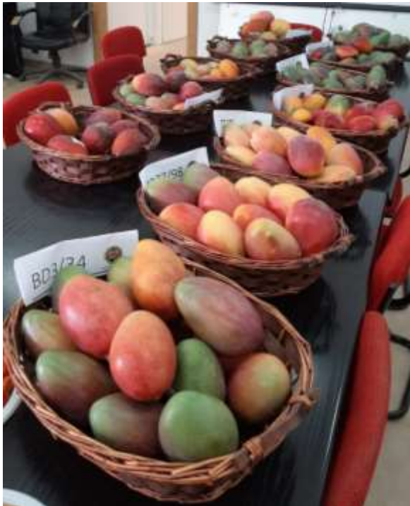
תמונה 4: תערוכת זני מגנו שהתקיימה כחלק ממפגש מגדלים בנושא גידול מגנו בנגב המערבי (מו"פ דרום, ספטמבר 2019)

לחלקת הבחינה של זני וקווי המנגו במו"פ דרום מספר תפקידים. מעבר לבדיקת הזנים השונים בתנאי הנגב המערבי, החלקה חשובה כחלקת מודל לאזור, בה יוצגו הקווים למגדלים ויוצג ממשק המניעה של התפשטות מחלת עיוות התפרחות. למרות העיכוב בצימוח עצים נושאי פרי, הוחלט להשאיר פירות רבים עם העצים ולהציגם לחקלאי האזור. במפגש מגדלים בנושא מנגו בנגב המערבי שערכנו במו"פ דרום בספטמבר 2019 במסגרת הפרויקט הצגנו, בסיוור החלקה, בהרצאה ובתערוכת פירות (תמונה 4), את הפוטנציאל של זני פרויקט השבחת המנגו הישראלי בתנאי הנגב המערבי. ביום העיון השתתפו למעלה מ-20 מגדלים מהאזור שהתעניינו בנטיעה חדשה של חלקות מנגו במשקיהם. בעקבות המפגש פנו מספר מגדלים בכוונה לטעת חלקות מנגו מזנים חדשים בערבה.